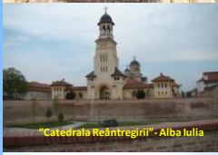
"Catedrala Reînălțării" - Alba Iulia