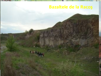
Basaltele de la Răcoș