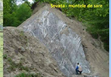
Sovata - muntele de sare