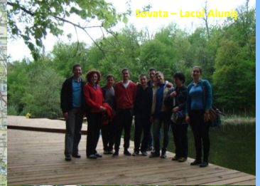
Sovata - Lacul Alunilor

Traseu aplicativ Zina 1: Suceava-Bicaz-Lacu Rău-Sovata Zina 2: Sovata-Sighișoara-Răcoș-Peștera-Brășov Zina 3: Brășov-Rășnov-Bran-Brășov Zina 4: Brășov-Sibiu-Schei-Alba Iulia-Mihai Viteazul Zina 5: Mihai Viteazul-Salina Turda-Cheile Turzii-Mihai Viteazul Zina 6: Mihai Viteazul-Turda-Cluj-Napoca-Bistrița-Suceava