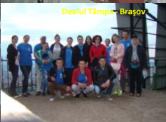
Dealul Tâmpar - Brașov