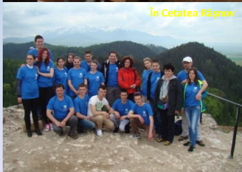
În Cetatea Rășnov