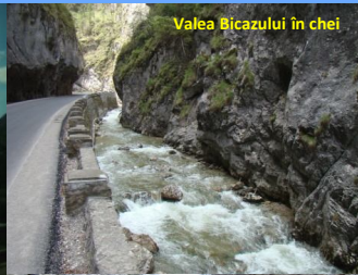
Valea Bicăzului în chei