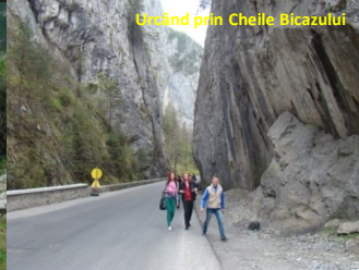
Creșând prin Cheile Bicăzului