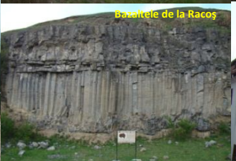
Basaltele de la Răcoș