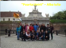
"Poarta Unirii" - Alba Iulia