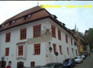
Sighișoara - Casa cu cerb