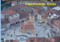
Piața Primăriei - Brașov