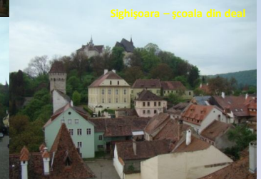
Sighișoara - Turnul Primăriei