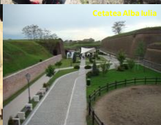
Cetatea Alba Iulia