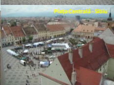
Piața Centrală - Sibiu