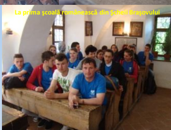
La prima școală românească din satul Brașovului