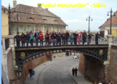
"Podul minciunilor" - Sibiu