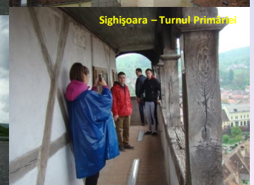
Sighișoara - Turnul Primăriei