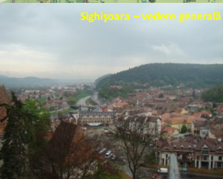
Sighișoara - vedere generală