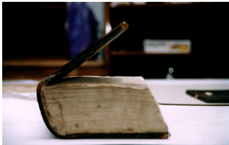
Foto 5. Ansamblu de copertă înainte de conservare

Pe lângă cele semnalate o problemă deosebită apare în cazul tuturor copertelor din piele care din cauza deshidratării avansate și-au micșorat suprafața îndeosebi pe porțiunea cotorului și nu mai permit închiderea cărților. Tratamentul aplicat consta în rehidratare și emolieri treptate care au ca efect readucerea copertei la dimensiunile inițiale.