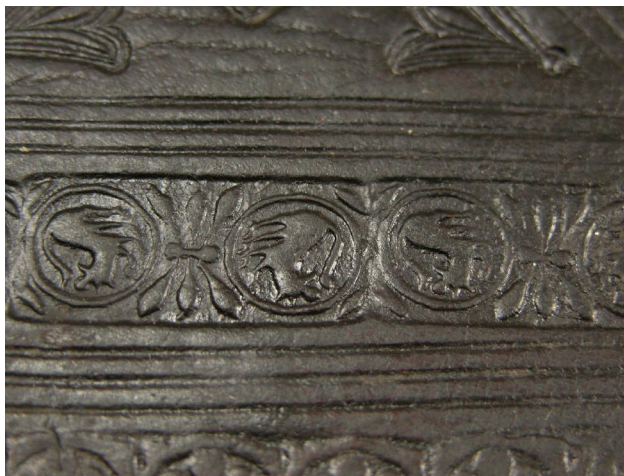
Foto 6. Detaliu față, copertă Minei anonim pe octombrie

Particularitatea comună tuturor coperților din piele ce îmbracă manuscrisele ștefaniene constă în deosebirea de motiv existentă între cele două fețe ale copertei: