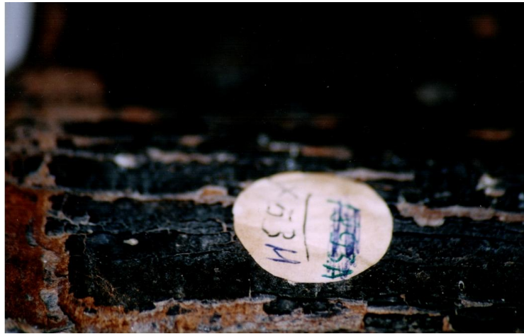
Foto 4 Detaliu de degradare chimică, la cotor.

Degradările fizico-mecanice se pot remedia local fără a depăși limita unor operații de conservare activă și constau în efectuarea unor tratamente de curățare a suprafețelor prin aspirare și periere, îndepărtarea petelor de ceară și a murdăriei aderente ș.a.