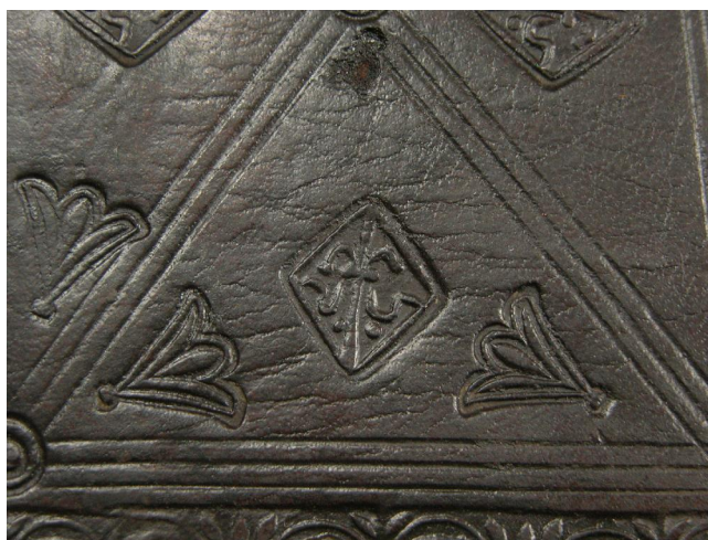
Foto 7. Detaliu verso, copertă Minei anonim pe octombrie